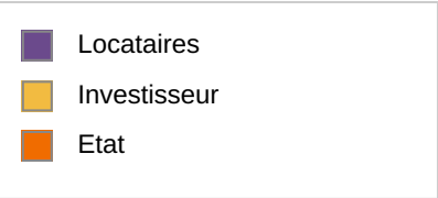
Financement de l'investissement