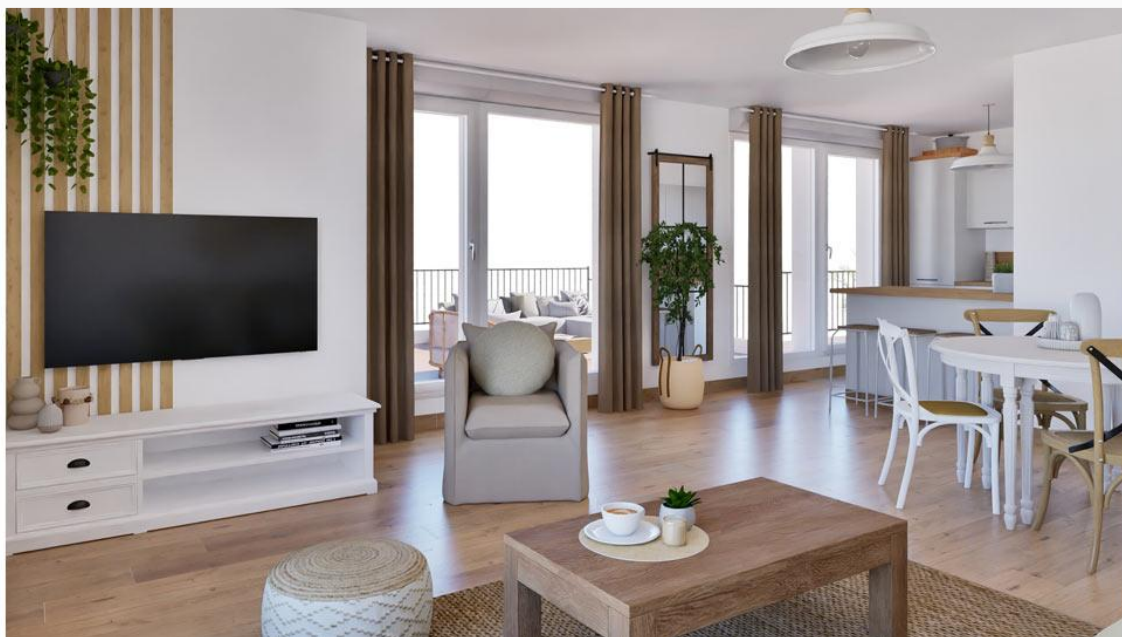
PALOMA - 06A103 (T4)